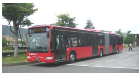
来年度より運行の連節バス

び: 今回の答弁で二社目の誘致決定の発表がありました。自動車のバネ・座金のメーカーで、海外に対する保険のような位置付けとも聞いています。ものづくりが海外に流出する中、国際情勢の不安定さに危機感を感じるこの頃ゆえに納得できる考え方です。